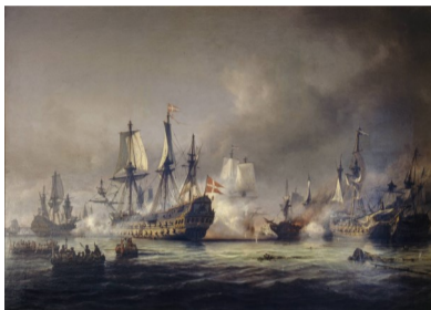
Slaget i Køge Bugt, Niels Juul

Skånske krig 1675-1679. Der var stærke kræfter, der talte for en revanchekrig mod Sverige. Sverige og Danmark var i modsatrettede alliancer, og da