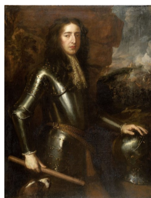
Wilhelm af Oranje

Den Nederlandske Hævnkrig, 1672-1678. Frankrig og England gik mod Nederlandene. Efter en revolution blev Wilhelm af Oranje valgt til statholder i Nederlandene. Under hans ledelse vendte krigslykken, og der blev sluttet fred i Nijmegen 1678.